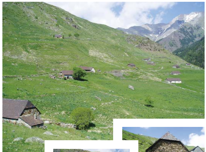
Bordas pastoriles de Viados