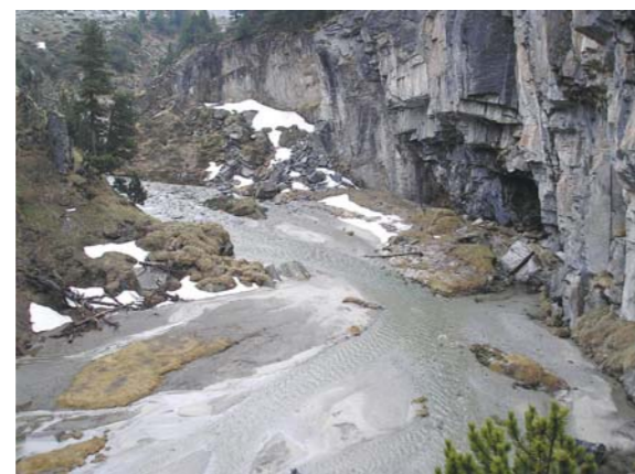
Forau de Aiguallut