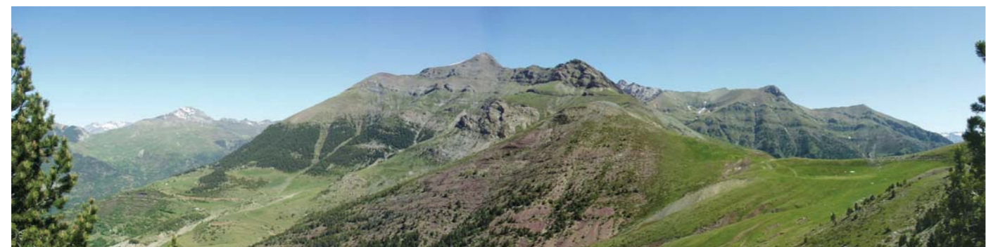
Vista panorámica del Parque Natural desde el Puerto de Sahún

Como apoyo a estos pasos se construyeron en la Edad Media unos pequeños albergues denominados "hospitales". Algunos de ellos, como el de Benasque o el de Loaron, se han mantenido hasta la actualidad, hoy en día equipados con modernas infraestructuras turísticas.