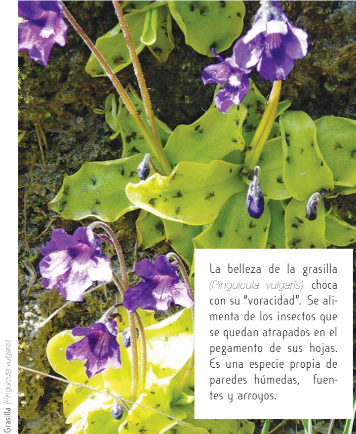
Grasilla (Pinguicula vulgaris)

La vida en el Parque, sobre todo la vegetación, se escalona según la altura y las condiciones ambientales en los llamados "pisos bioclimáticos". En el piso montano (menor altitud) nos encontramos con especies como serbales, avellanos y abedules. En las laderas más húmedas aparecen hayas, pinos, abetos y, en las cotas más altas, el pino silvestre da paso al pino negro, que es la última especie que encontramos antes de entrar en los pisos alpino y nival, donde las condiciones para la vida son muy duras. Las tascas y pastizales, con sus características flores alpinas, dan paso a la roca desnuda, parcialmente cubierta por líquenes.